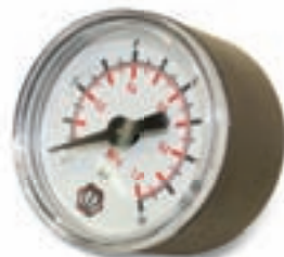
Manometro Ø 40 mm, con attacco coassiale da 1/8" gas