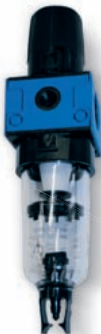
Filtro-riduttore di pressione da 1/2" gas