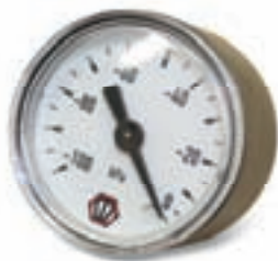
Vuotometro Ø 40 mm, con attacco coassiale da 1/8" gas