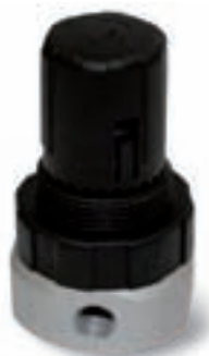
Riduttore di pressione da 1/8" gas