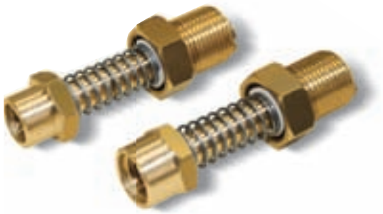
VERSIONE 20 .. 11